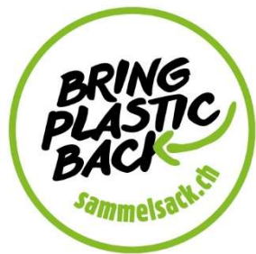
Die neue, zertifizierte Recyclinglösung ist Teil des Systems «Bring Plastic back», das sich bereits in hunderten von Gemeinden bewährt hat.