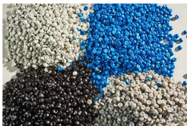
Mit «Bring Plastic back» wird der Haushalt-Kunststoff recycelt und zu Regranulat verarbeitet.