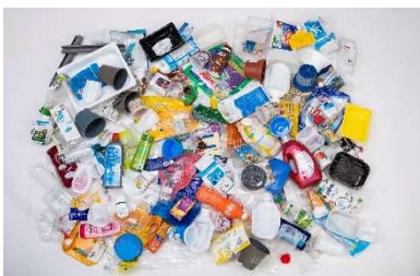
In den Haushalten fallen immer grössere Mengen von Lebensmittel- und Haushaltverpackungen aus Kunststoff an.