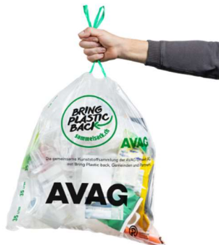
So wird der neue Sammelsack im Kanton Bern aussehen. An den Sammelstellen können aber alle Säcke mit dem Logo von «Bring Plastic back» abgegeben werden.